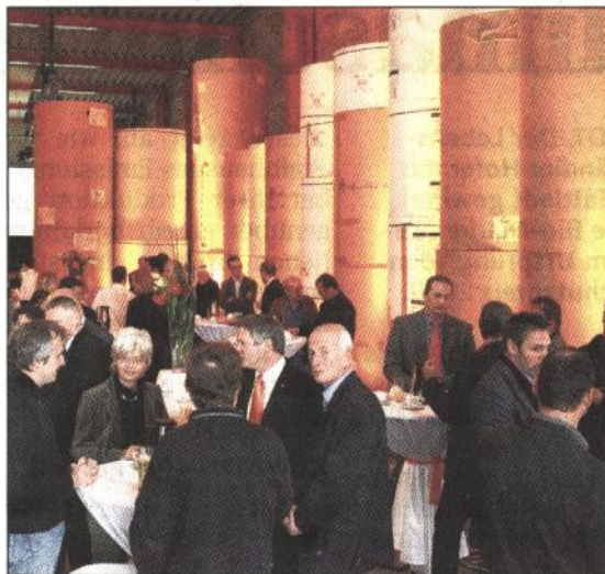
Die Eventwerkstatt gestaltet Messestände, Produktpräsentationen und inszeniert Firmenjubiläen.

Die Eventwerkstatt, Agentur für Erlebniskommunikation aus Linz ( www.eventwerkstatt.at ), geht auch personell gestärkt in die Zukunft. Im